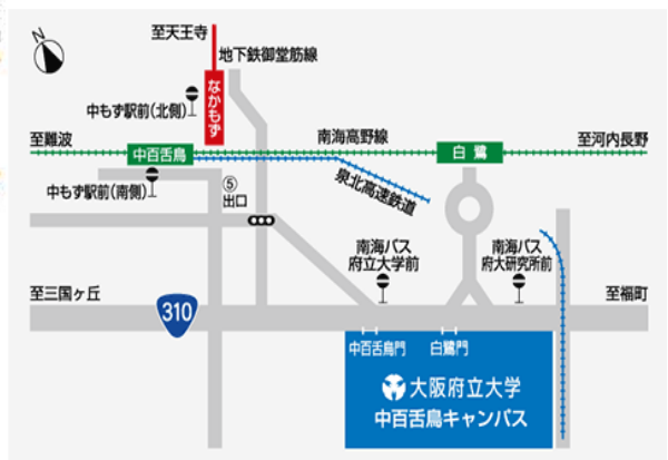
大阪府立大学中百舌鳥キャンパス Osaka Prefecture University Nakamozu Campus Map