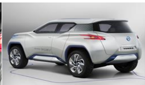
『Terra (テラ) コンセプト(2012年パリモーターショー出展)』